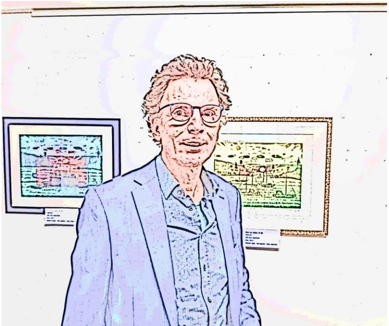
Radierungen, Text/ Narration dazu Stand: 01.03.2024

Haltung bewahren. Optimistisch denken. Umsichtiges kommunikatives Handeln.